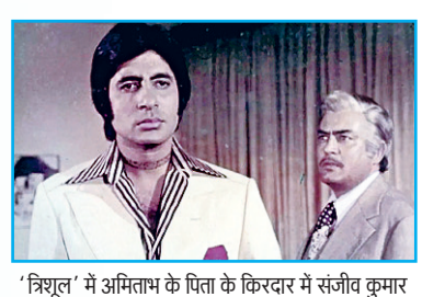
'त्रिशूल' में अमिताभ के पिता के किरदार में संजीव कुमार

दूसरे को कह देते थे-संजीव कुमार बन रहे हो? संजीव कुमार के द्वारा निभाए गए यादगार किरदारों में 'मौसम' के डॉक्टर अमरनाथ को कैसे भूला जा सकता है? इस फिल्म में उनका डबल रोल, शर्मिला टैगोर के रोल से किसी तरह से कमतर नहीं रहा। इसी तरह फिल्म 'त्रिशूल' तो अमिताभ की कही जाती है, लेकिन इसमें संजीव कुमार ने एक ऐसे व्यापारी का रोल प्ले किया, जो अंजाने में ही अपने बेटे से व्यापारिक संघर्ष कर रहा होता है और उसे पता ही नहीं चलता। इसमें पिता-पुत्र के संवाद, दो प्रतिद्वंद्वी व्यापारियों की उस लड़ाई का प्रतिनिधित्व करते हैं, जिसमें वे अपनी जीत के लिए किसी भी स्तर तक जा सकते हैं। उन पर फिल्माए गाने भी हुए हिट: संजीव कुमार पर फिल्माए गाने भी सुपरहिट रहे। 'अनोखी रात' का गीत 'ओह रे ताल मिले नदी के जल में, नदी मिले सागर में', 'खिलौना' का 'खिलौना जानकर तुम तो', 'सीता और गीता' का 'हवा के साथ-साथ, 'अनामिका' का 'मेरी भीगी भीगी सी पलकों पे', 'आंधी' का 'तुम आ गए हो, नूर आ गया है', 'मौसम' का 'दिल दूढ़ता है फिर वहीं फुसंत के रात-दिन' और 'सिलसिला' का 'रंग बरसे', हर दौर के हिट गानों की श्रेणी में गिने जाते हैं। अधूरी रही प्रेम की दास्तान: संजीव कुमार ने जिस तरह से फिल्मों में अपना परचम लहराया, उसी तरह से उनके प्रेम के चर्चे भी खूब सुने जाते रहे। हेमा मालिनी के साथ के किस्से तो सर्वाधिक चर्चित रहे ही हैं। सुलक्षणा पंडित के साथ भी उनकी जोड़ी चर्चित रही पर वह भी अपने मुकाम पर पहुंचने से रह गईं। खुद के बारे में भी कई अपनी ही भविष्यवाणी को सच साबित करते हुए जीवन के पचास बसंत पूर्ण करने से पहले ही 6 नवंबर 1985 को अनंत आकाश में हमेशा-हमेशा के लिए विलीन हो गए। k