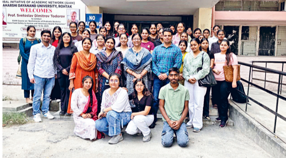
रोहतक। प्रतियोगिता में भाग लेने वाली प्रतिभागी व शिक्षक।