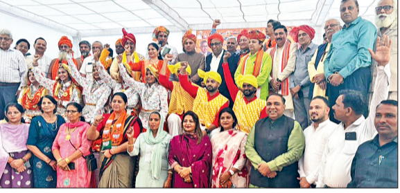
रोहतक। भाजपा एमएसएमई प्रकोष्ठ जिला रोहतक की नवनि्युक्त इकाई।

हरियाणा दिवस के शुभ अवसर पर भारतीय जनता पार्टी द्वारा एक महत्वपूर्ण पहल के रूप में हरियाणा एमएसएमई (सूक्ष्म, लघु एवं मध्यम उद्योग) सेल के जिला इकाई का गठन किया गया है। यह कदम देश की सबसे बड़ी राजनीतिक पार्टी भाजपा एवं भारत के यशस्वी प्रधानमंत्री नरेंद्र मोदी के मार्गदर्शन में हरियाणा के एमएसएमई क्षेत्र को सशक्तिकरण एवं विकास व आत्मनिर्भर भारत की दिशा में एक बड़ा कदम है। इस इकाई की प्रारंभिक शुरुआत