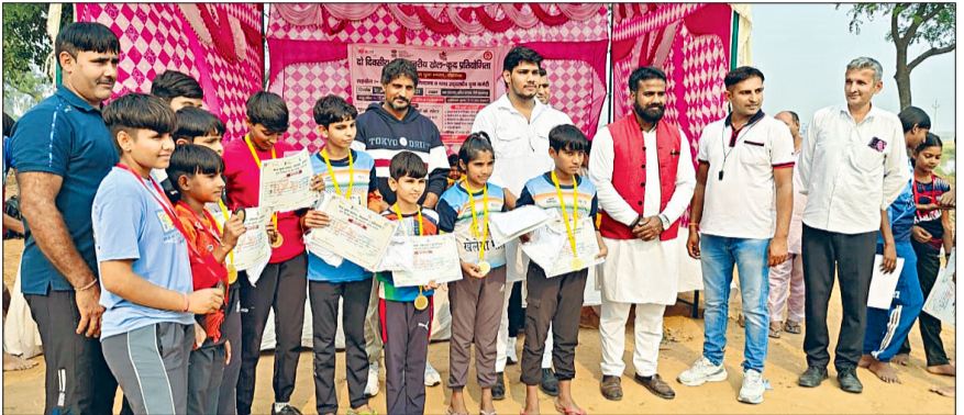
महम। खंड स्तरीय खेल प्रतियोगिता में विजेता रहे खिलाड़ियों को प्रशंसा पत्र प्रदान करते खेल आयोजन समिति सदस्य।