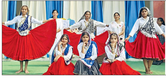
महम। हरियाणा दिवस के उपलक्ष्य पर आयोजित सांस्कृतिक कार्यक्रम में भाग लेती डॉ. रामचंद्रा विद्यापीठ की छात्राएं।